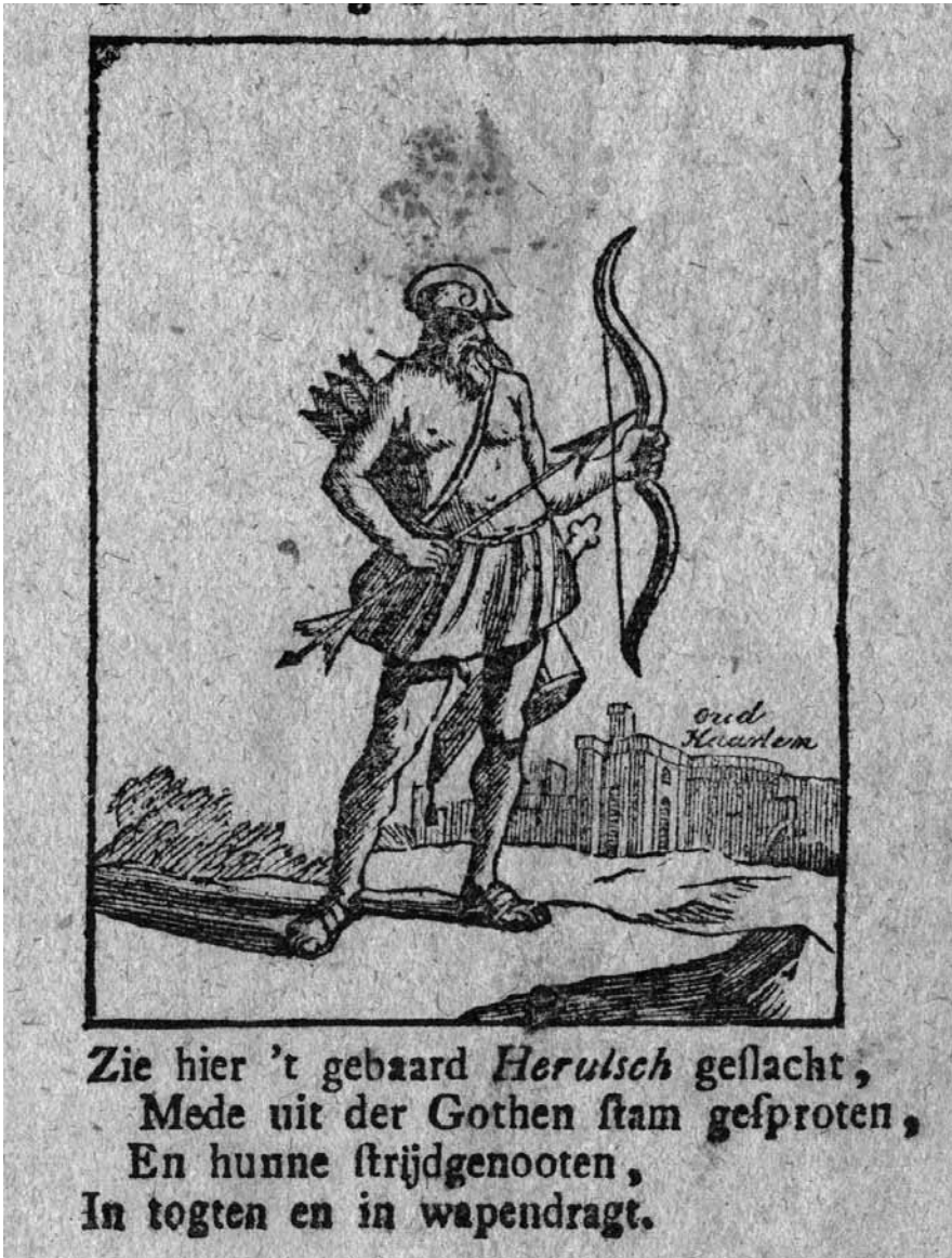
Afb. 5: Het volk der Herulers, dat Haarlem stichtte, verbeeld op prent Noman #H. Collectie Thijssen.

twintig woorden (zie afb. 5), terwijl een vereenvoudigde nadruk van deze afbeelding op de prent Glenisson & Van Genechten # 105 nog slechts een onderschrift van tien woorden kende.