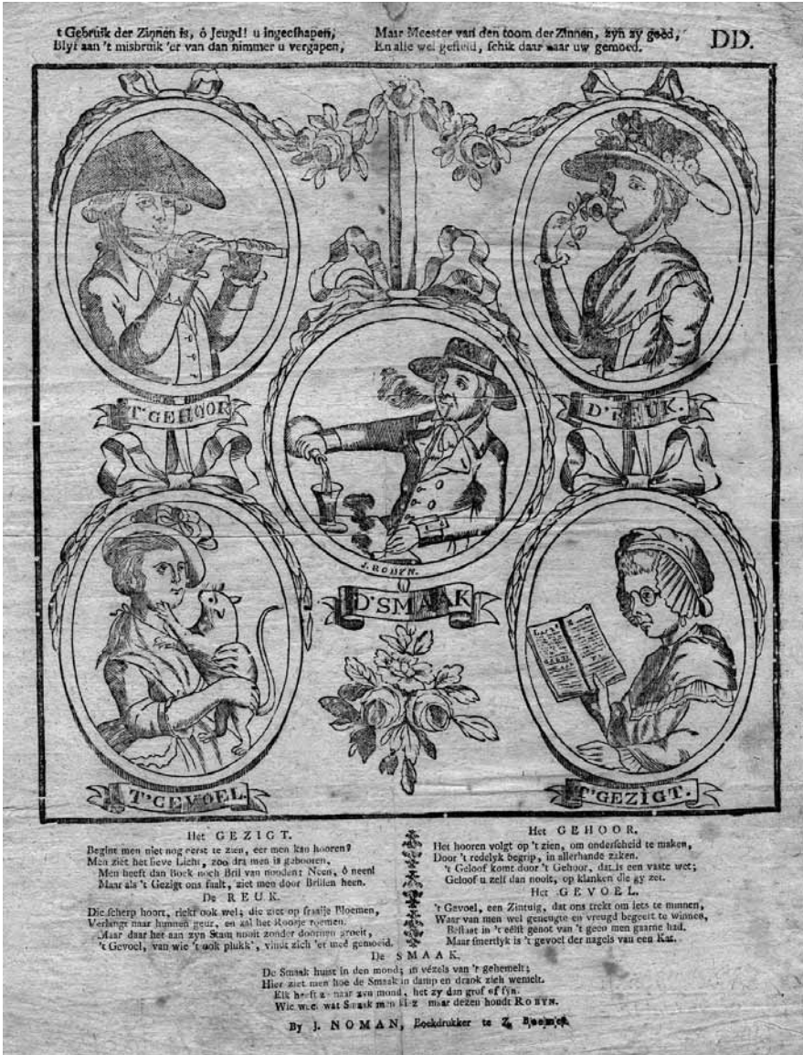
Afb 4: Pseudo-Nutsprent Noman #DD, met allegorie van de vijf zintuigen. Collectie Thijssen.

Nutsreeks gebruikt, maar zonder dat het Nutsvignet als keurmerk van echtheid erboven prijkte.