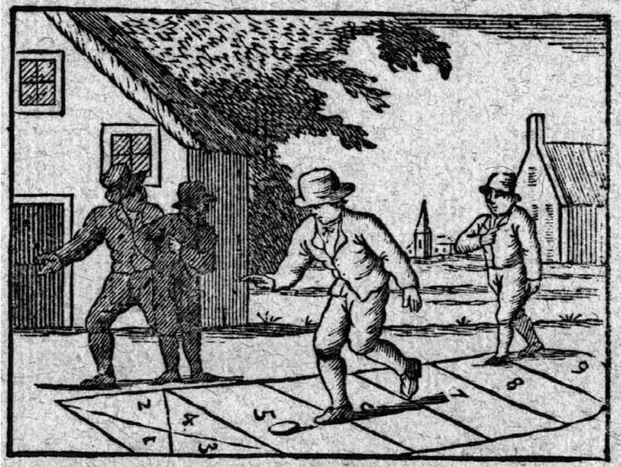
Afb. 2: Hinkelspel op een educatieve prent van het Nut. Collectie Thijssen.

Nutsreeks, geheel voor eigen rekening en risico een omvangrijke traditionele prentenserie op de markt gebracht van meer dan honderd verschillende volksprenten. 7 Deze commerciële prenten waren, zoals gebruikelijk bij volksprenten, gekenmerkt met een of meer cijfers: het prentnummer in de rechter bovenhoek, ten einde misverstanden bij bestellingen te voorkomen, terwijl het 'adres' (= uitgeversnaam en locatie) doorgaans in de ondermarge van volksprenten werd vermeld.