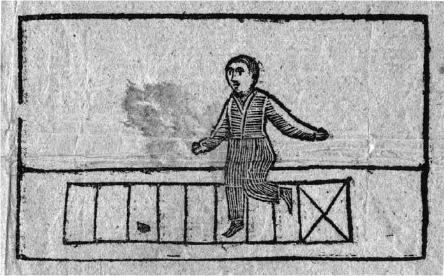
Afb. 1: Hinkelspel op traditionele kinderprent.

rende jeugdpercepties werden door de Maatschappij tot Nut van 't Algemeen omhelsd en uitgedragen (Lenders 1988). Een van de consequenties daarvan was dat de alom gebruikte, nogal platvloerse en zelfs onzedelijke volks- en kinderprenten uit de scholen moesten verdwijnen.